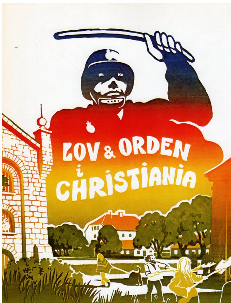
Billeder fra de to udstillinger

Husk frokost eller penge til mad – og fornuftigt påkældning