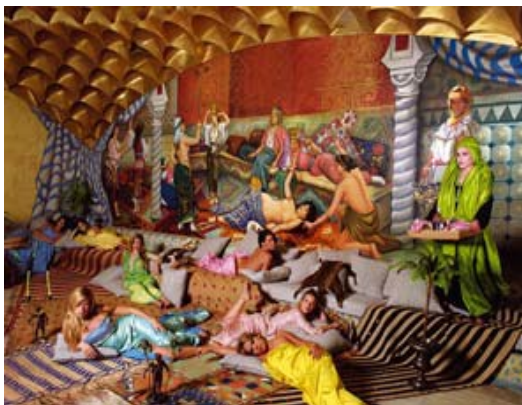
Foto: Tina Enghoff fra udstillingen "Eventuelle pårørende" Nikolaj Udstillingsbygning '03 og Daniella Rossell fra udstillingen "Rige og berømte" Nikolaj Udstillingsbygning '04